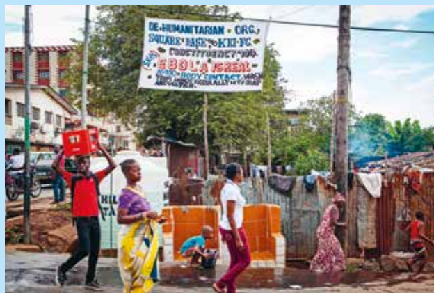
Bannière de sensibilisation de la population contre le virus mortel Ebola (Sierra Leone, Freetown)

Parmi les crises humanitaires du moment, Ebola en Afrique de l'Ouest où les personnes handicapées sont parmi les plus exposées au virus en raison de leurs déficiences. Elles font face à des obstacles importants dans l'accès aux services et aux informations avec des messages qui s'entremêlent souvent aux rumeurs, aux idées fausses ou aux croyances traditionnelles parfois délétères.